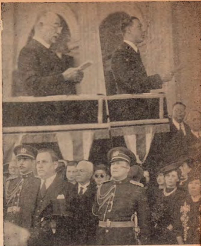
Pronunciaron elocuentes discursos: nuestro ilustre Canciller Lic. don Alberto Echandi y el Excmo. Sr. Ministro de Guatemala don Alfonso Carrillo.

Un caballero en la más limpia acepción del vocablo murió el 19 de marzo. Un caballero que vivió en continua función de nobleza. Se prodigó sin cálculos en la vida del hogar — santuario de paz y honor; — se prodigó en la vida pública, en la cual deja escrita una página sin manchas; se dió por entero al servicio de Costa Rica, ya desde diversas secretarías de estado, de altas posiciones