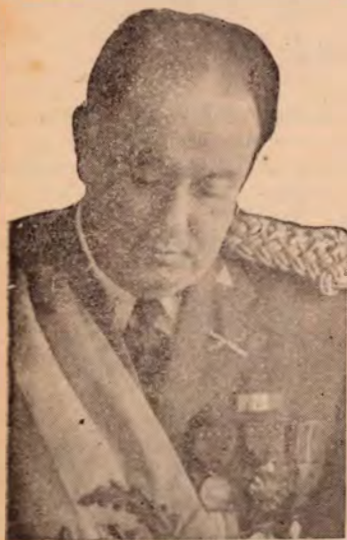
REAL. ANASTASIO SOMOZA

A Presidente de la República: General Anastasio Somoza Managua.