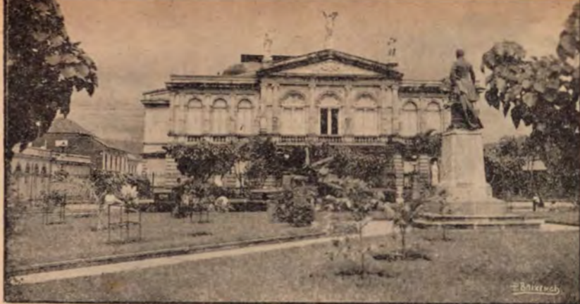
El Teatro Nacional de Costa Rica.