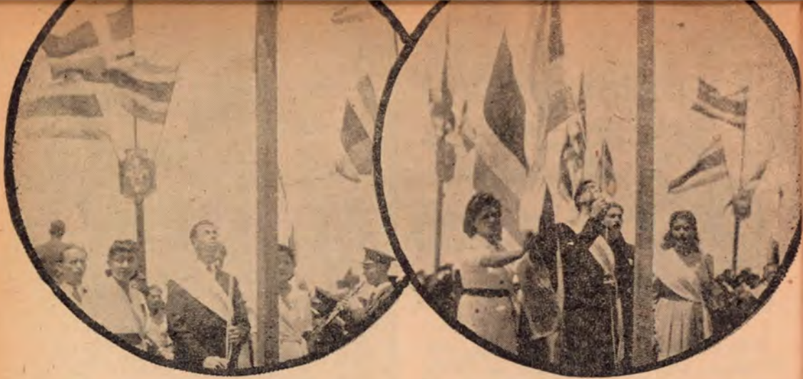
Momentos en que eran izadas las Banderas de Costa Rica y de la Universidad