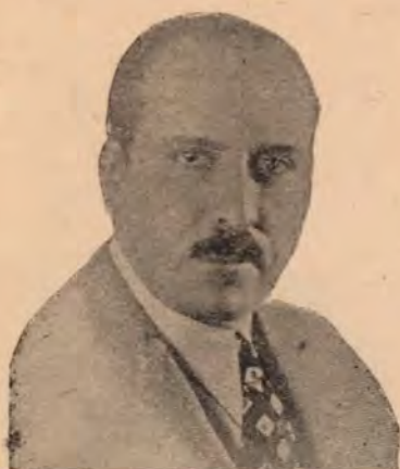
Excmo. Sr. Dr. don CARLOS A. ARROYO DEL RÍO.

El 1º de setiembre de 1940 entró a ocupar la Primera Magistratura de la República del Ecuador, por un período de cuatro años, el eminente juriconsulto doctor Carlos Arroyo del Río, quien desde el año de 1932 había sido postulado por distinguidos personajes de su país para ocupar este elevado cargo, pero se había excusado de aceptar este honor por no haber cumplido la edad constitucional requerida, que según el artículo 73 de la Constitución debe ser por lo menos de cuarenta años.