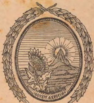
UNIVERSIDAD DE COSTA RICA

Y en un reconocimiento de los tradicionales lazos de fraternidad que vinculan a los países centroamericanos con la que fuera metrópoli del Reino de Guatemala y en los primeros días de la vida independiente, capital de la Federación